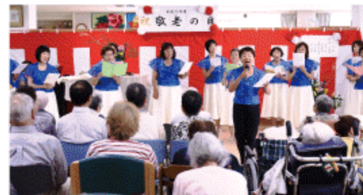
コーラスあじさいの方々が、歌って下さいました。

また今年は、皆さまの胸に、お祝い年で色を違えた職員手作りのブローチをお付けしました。