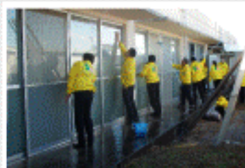
全労済の方々による清掃ボラ