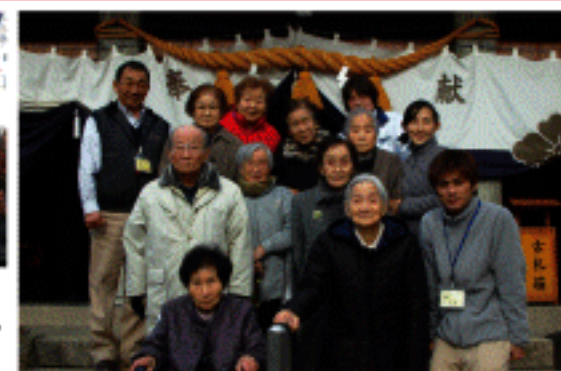
1 月 初詣