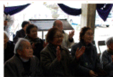
今年も楽しく元気に過ごすことが出来ますように...