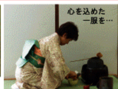
心を込めた一服を...