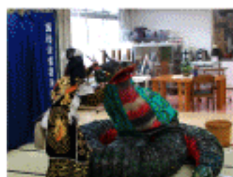
11 月 17 日 (土) 備中神楽