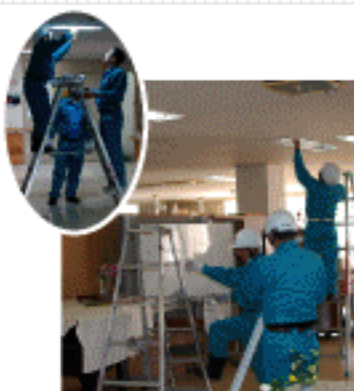
中国電力の方々による清掃ボラ