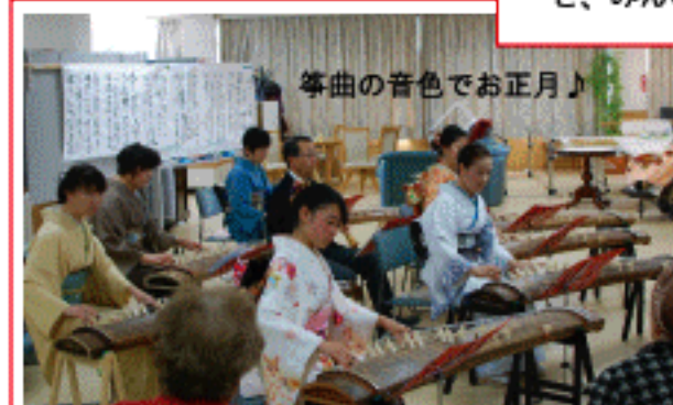
1 月 5 日 (土) 新春琴演奏会