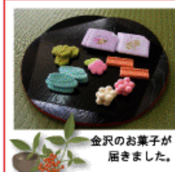
金沢のお菓子が届きました。