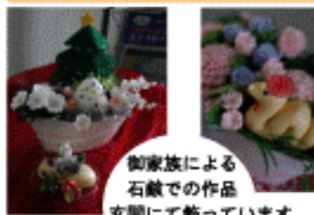
御家族による石版での作品玄関にて飾っています。